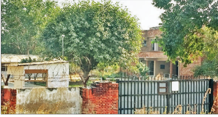
रेवाड़ी। ढाई साल से अधिक समय से बंद पड़ा यूथ हॉस्टल तथा यूथ हॉस्टल में जमा गंदगी व ऊगी खरपतवार।