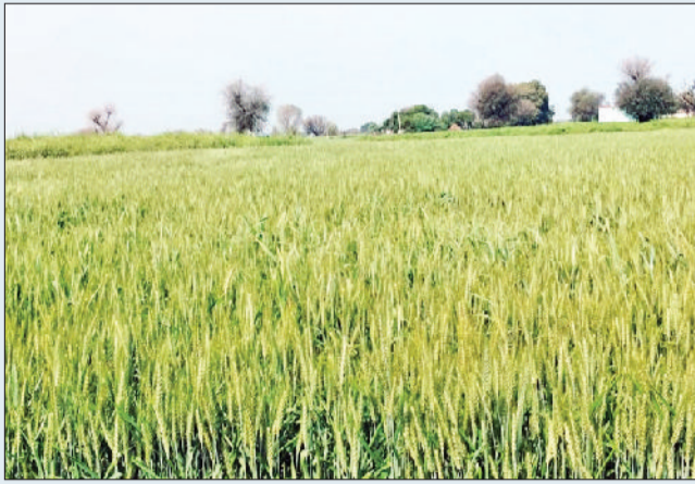
रेवाड़ी। एक खेत में गेहूं की फसल में निकली बालियाँ।

अभी तक मौसम ने किसानों और फसलों का अच्छा साथ दिया है। सरसों की अगेती फसल में दाना पकना शुरू हो गया है। गेहूं की फसल में बालियाँ निकल रही हैं। बारिश के बाद फसलों का तेजी से विकास हुआ है। मौसम अचानक गर्म होने से गेहूं की फसल प्रभावित हो सकती है। दिन के समय मिट्टी गर्म होने से दौमक जमीन से बाहर आकर गेहूं पर हमला सकती है, जिससे फसल को नुकसान हो सकता है। एक बार फिर से मौसम का मिजाज ठंडा पड़ता है, तो यह दोनों फसलों के लिए फायदेमंद साबित होगा। किसानों को फिक्र इस बात की है कि मौसम में बदलाव के साथ अगर ओलावृष्टि होती है, तो फसल को नुकसान पहुंचा सकती है।