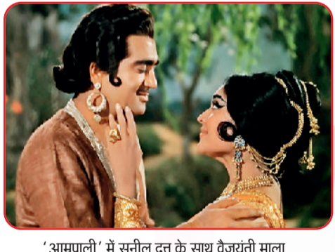
'आम्रपाली' में सुनील दत्त के साथ वैजयंती माला