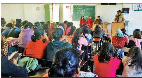
रेवाड़ी। छात्राओं व स्टाफ को जानकारी देते हुए पुलिस टीम।

महिलाओं व बच्चों की सुरक्षा व जागरूकता के लिए जिला पुलिस की ओर से शुकवार को गवर्नमेंट गर्ल्स कॉलेज गांव गुरावड़ा में कार्यक्रम का आयोजन किया गया। महिला थाना प्रभारी पीएसआई